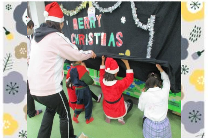
見つけたよ ミッションクリア