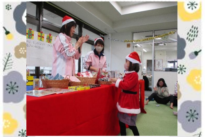
一番ビンゴ、おめでとう！！