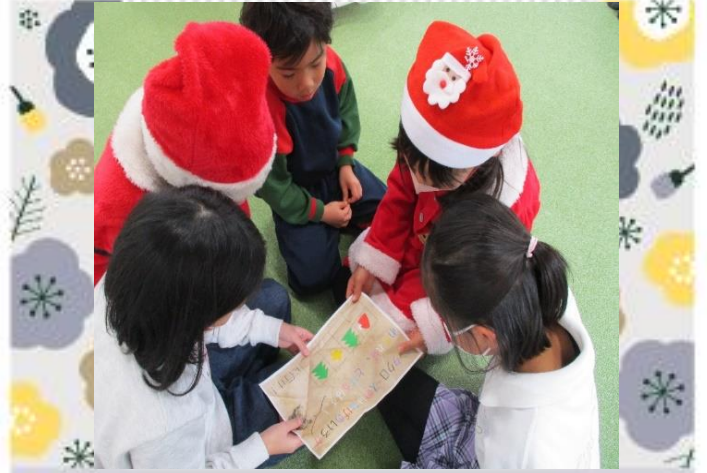
謎解きクリスマスミッション中