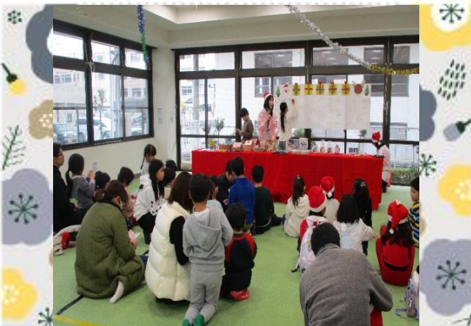
クリスマスビンゴ