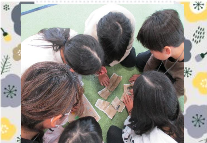
暗号を解いて・・・