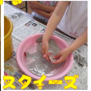
ペーパースタース