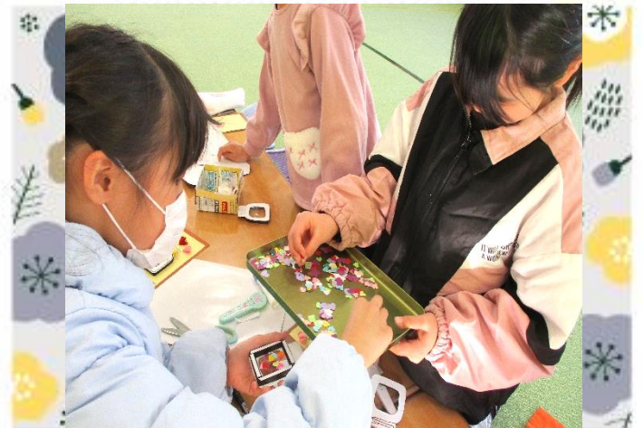
何色のパーツを入れようかな？