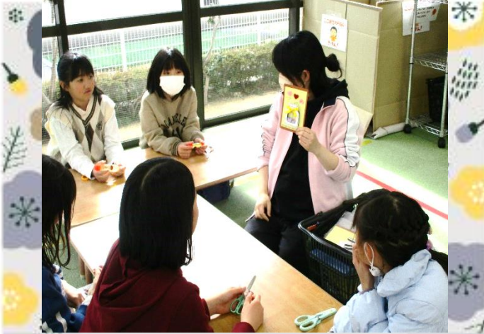
説明を聞いて作業スタート