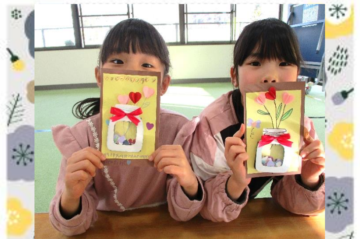
ハッピー バレンタイン！