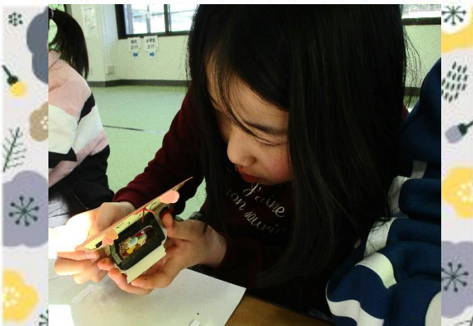
カラフルハートとビーズを入れて