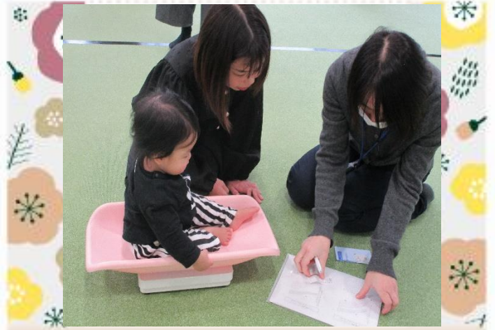
大きくなったかな？