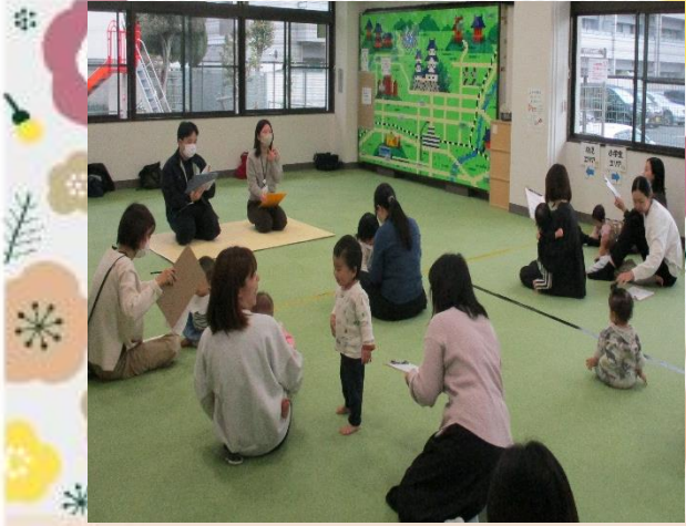
女性のメンタルヘルスについて