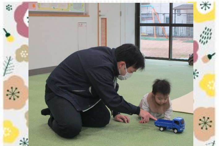
保健師さんと遊んだよ