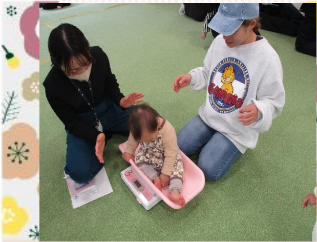
お話の後は身体測定