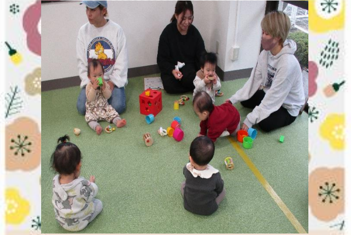
ママと一緒に話を聞くよ