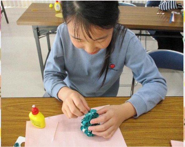
円錐形にどんどん貼って・・・