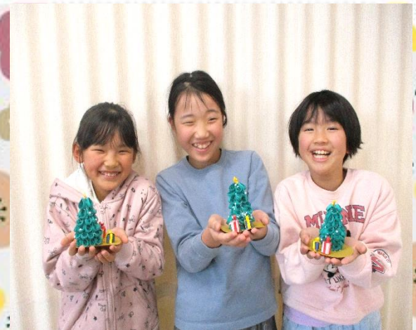
メリークリスマス！