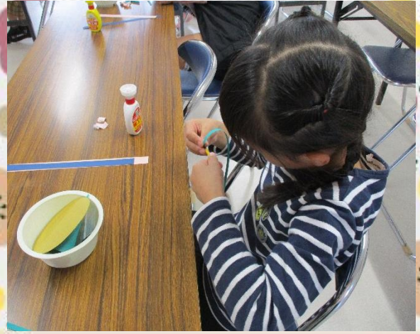
画用紙を巻きます。