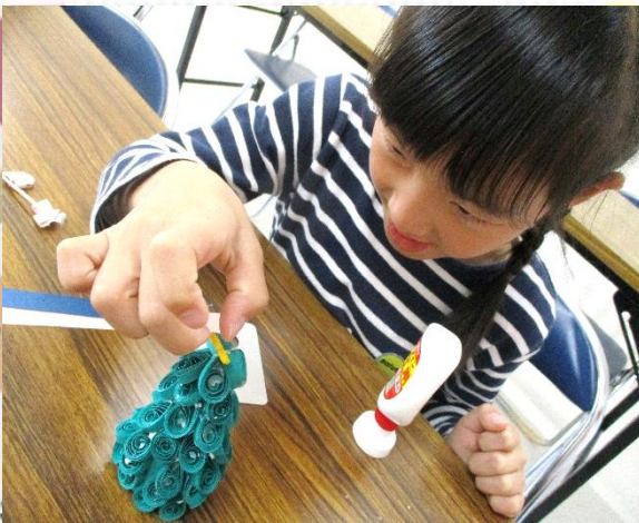
最後にお星さまも貼って・・・