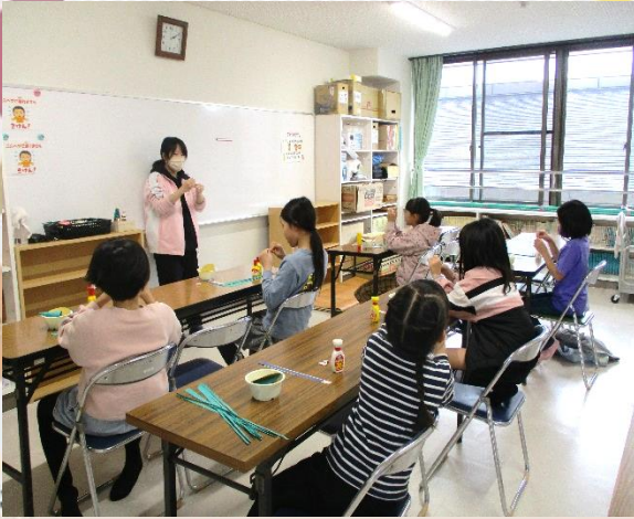
説明を聞いて、作業開始！