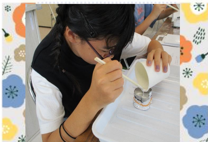
型の中にそ〜っと入れるよ