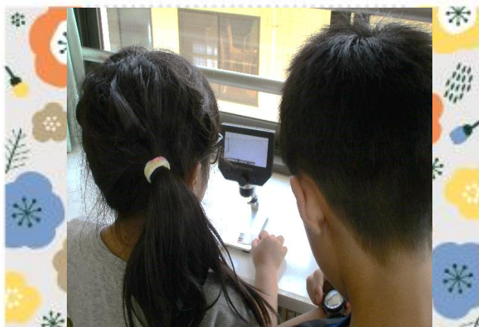
加熱している間に、えんぴつ等で書いた線を マイクروسコープでのぞいてみよう