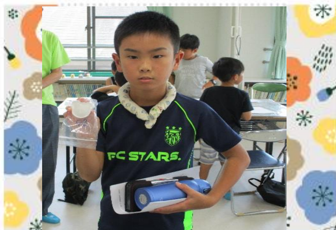
BIG サイズの消しゴムが出来上がり！！