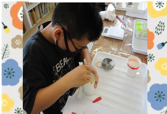
Aのコップに入れてゆっくり混ぜるよ