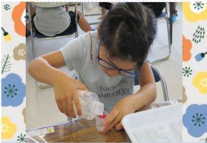
次に可塑剤を入れます