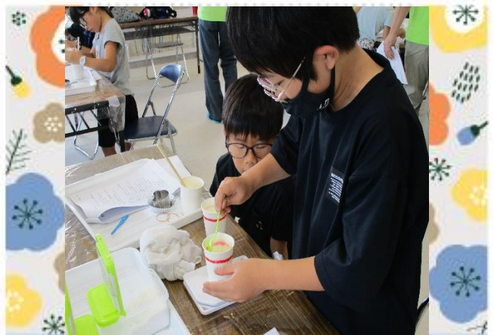
次は炭酸カルシウムを測って