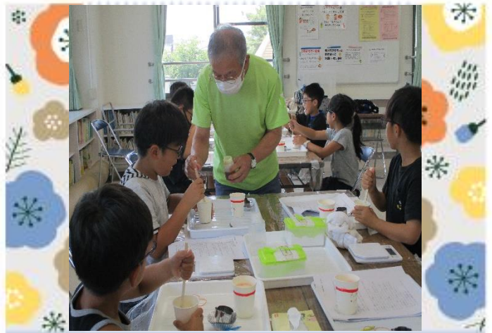
安定剤を2滴入れて・・・