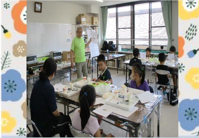
先生の説明中 安全のため眼鏡をかけて実験します