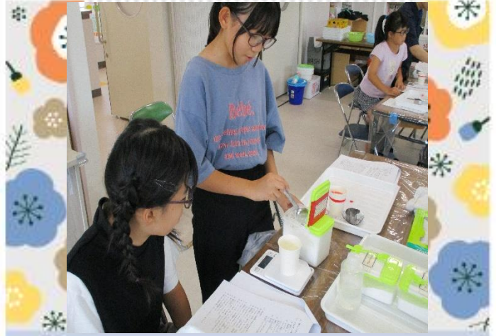
塩化ビニル樹脂をカップに入れるよ