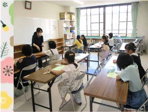
説明を聞いて、作業開始！