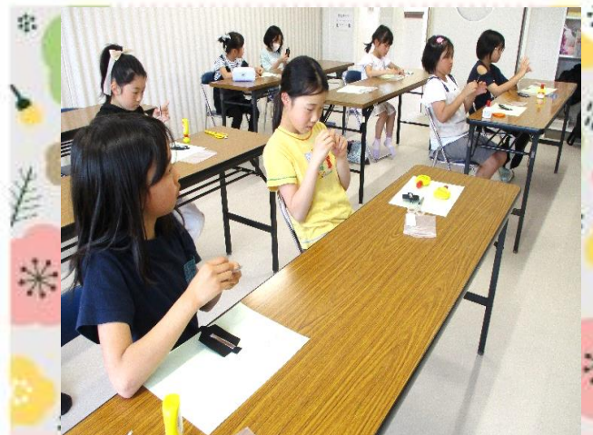
ボンドで貼ります。