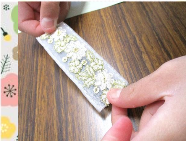
最後に刺しゅうを貼ります。