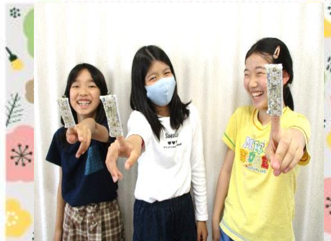
かわいく出来たね♪