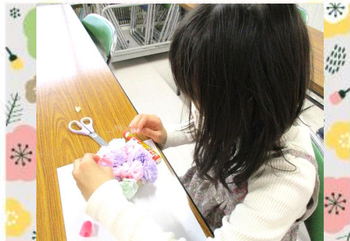
どんどん貼って・・・