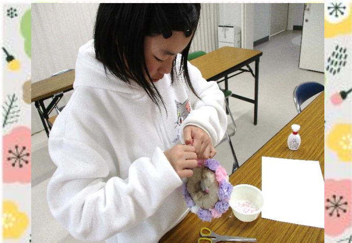
最後に麻紐をつけて・・・