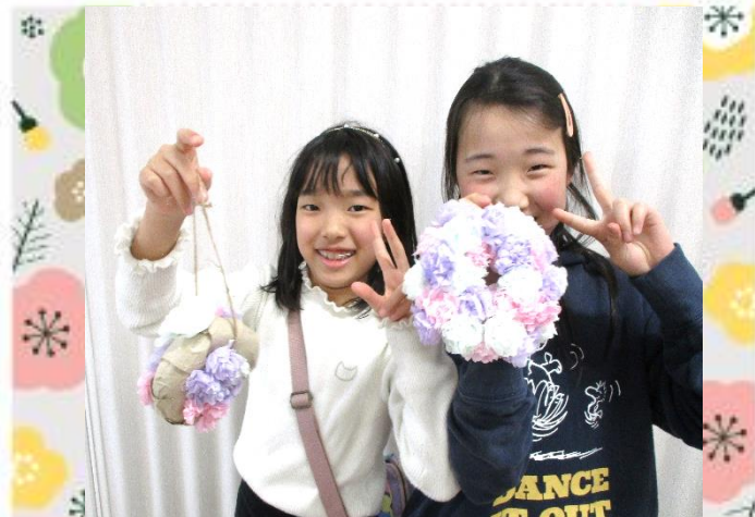
かわいく出来たね♪