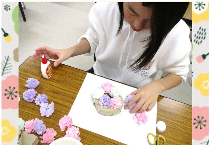
何色のお花を貼ろうかな？