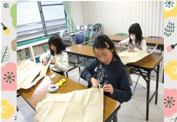
新聞紙のリースに、クラフト紙を巻きます。