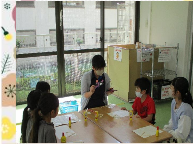
説明をしてから作業開始！