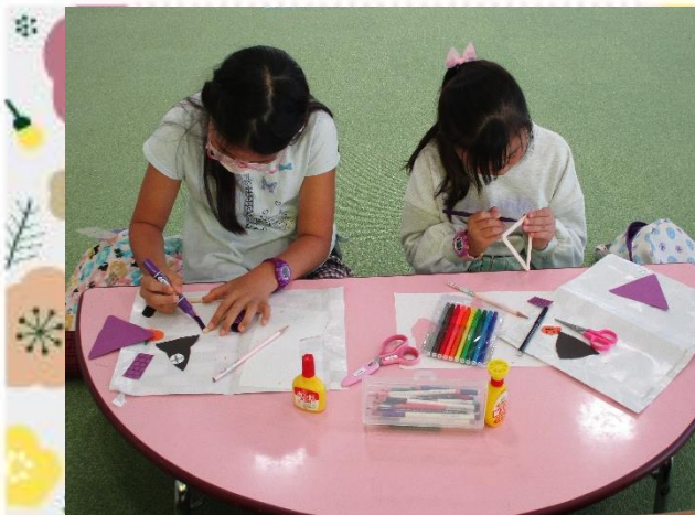
マーカーペンで色をぬるよ