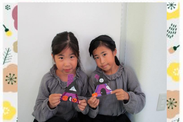
かわいくできたよ。