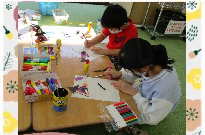
色画用紙を切って飾り付けをするよ