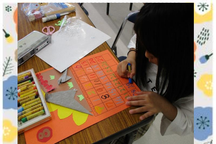
オリジナルカレンダーの出来上がり