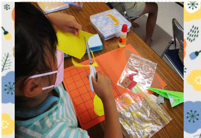
次はパーツを切っていきます