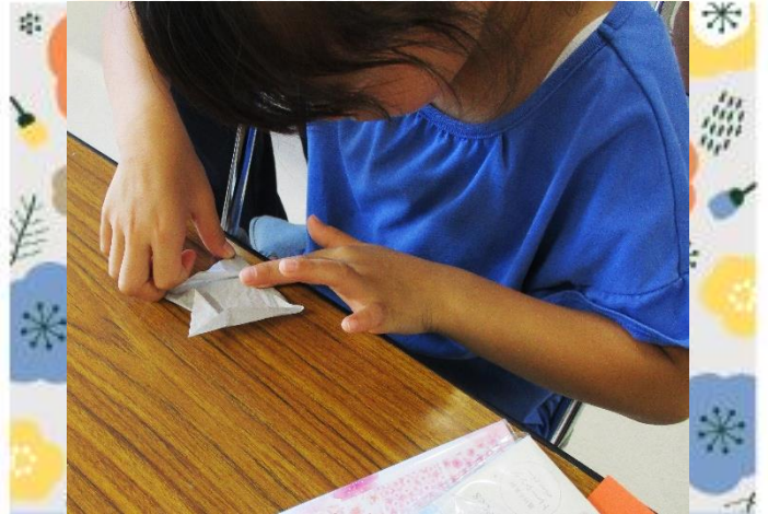
うまく折れるかな？