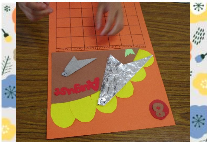
あとは恐竜を貼って・・・