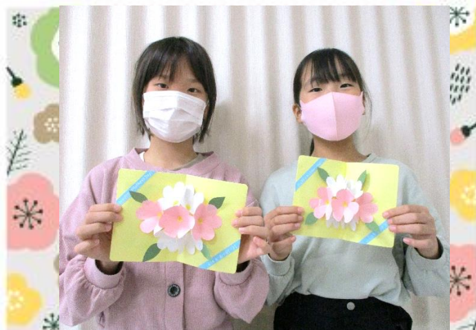
「お母さん、いつもありがとう♪」