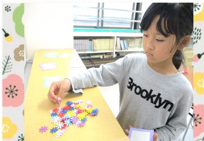
メッセージカードも作ります。