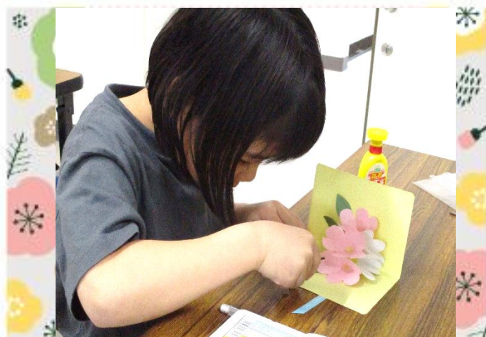
リボンの飾りを貼って…