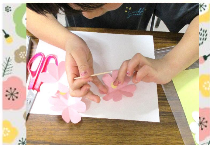
お花を、立体にしていきます。