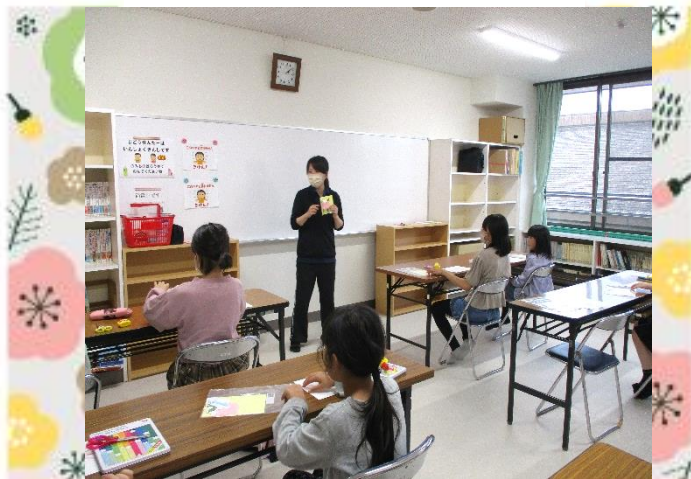
説明を聞いて、作業開始！