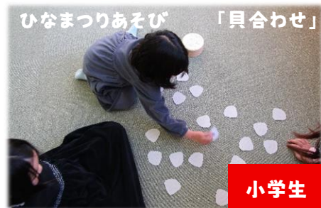
ひなまつりあそび 「具合わせ」