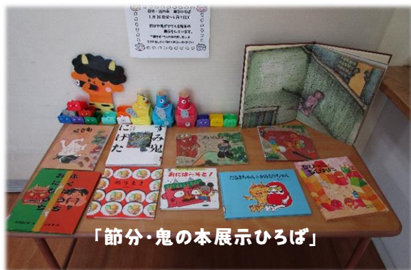
「節分・鬼の本展示ひろば」